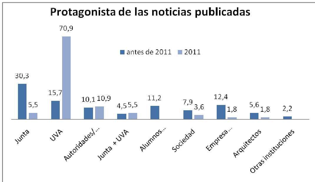
Gráfico 2. Comparación de los protagonistas de las noticias antes y después de la acción de comunicación (expresado en porcentajes).